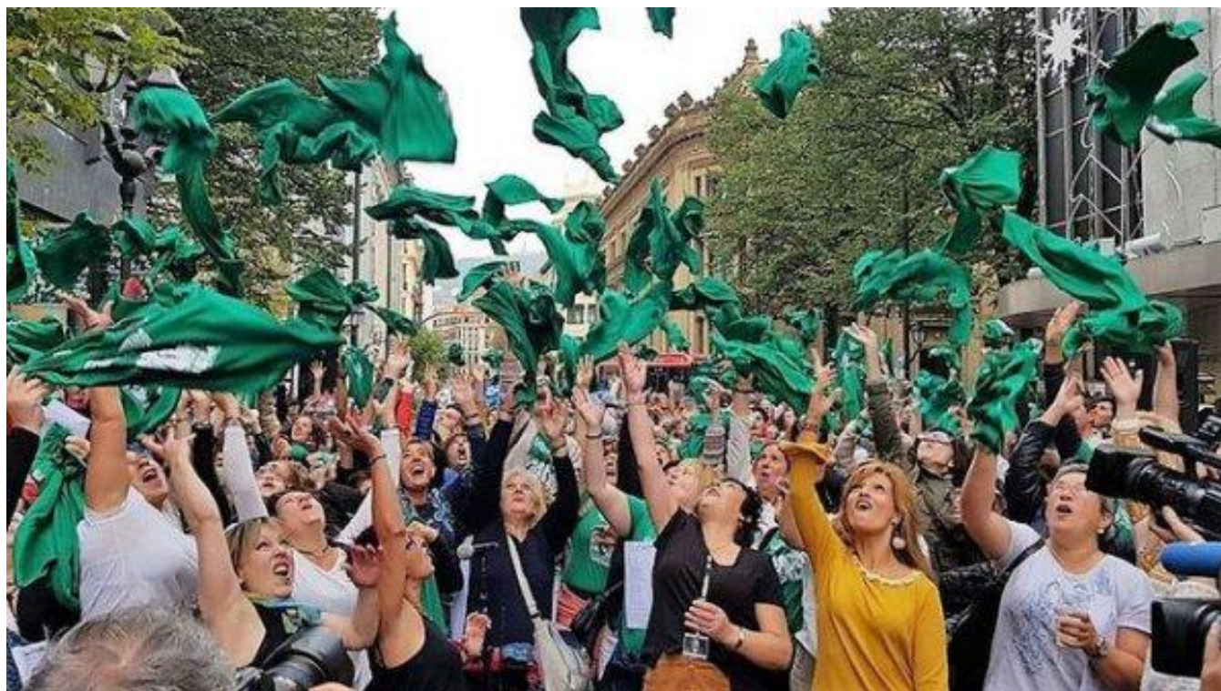
Trabajadoras de las residencias en Euskadi celebrando la victoria tras 370 días de huelga

POR UN PROCEDIMIENTO LEGAL Y GARANTISTA QUE RECONOZCA LOS SERVICIOS PRESTADOS DEL PERSONAL INTERINO